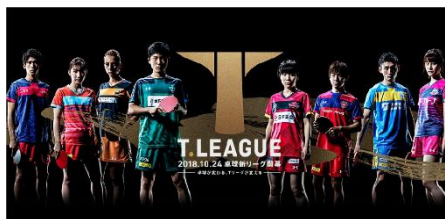
Tリーグ ビジュアル

2018年10月24日に両国国技館で開幕する卓球新リーグ「Tリーグ」。7日（日）には松下浩二チェアマンも登場し、日本とともに世界を代表するトップ選手が続々と参戦を表明し、開幕への期待が高まる中世界No.1リーグを目指す新リーグの魅力に迫ります。