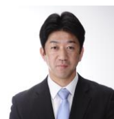
Tリーグ 松下浩二チェアマン