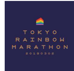
大会キービジュアル

「東京レインボーマラソン 2019」は、今後の世界のロールモデルとなるような多様性のある市民参加型スポーツイベントを目指し、3月2日（土）東京都立川市の国営昭和記念公園にて初開催されます。大会キービジュアルは東京 2020 オリンピック・パラリンピック競技大会エンブレムを手掛けたアーティスト・野老朝雄氏が担当。競技性